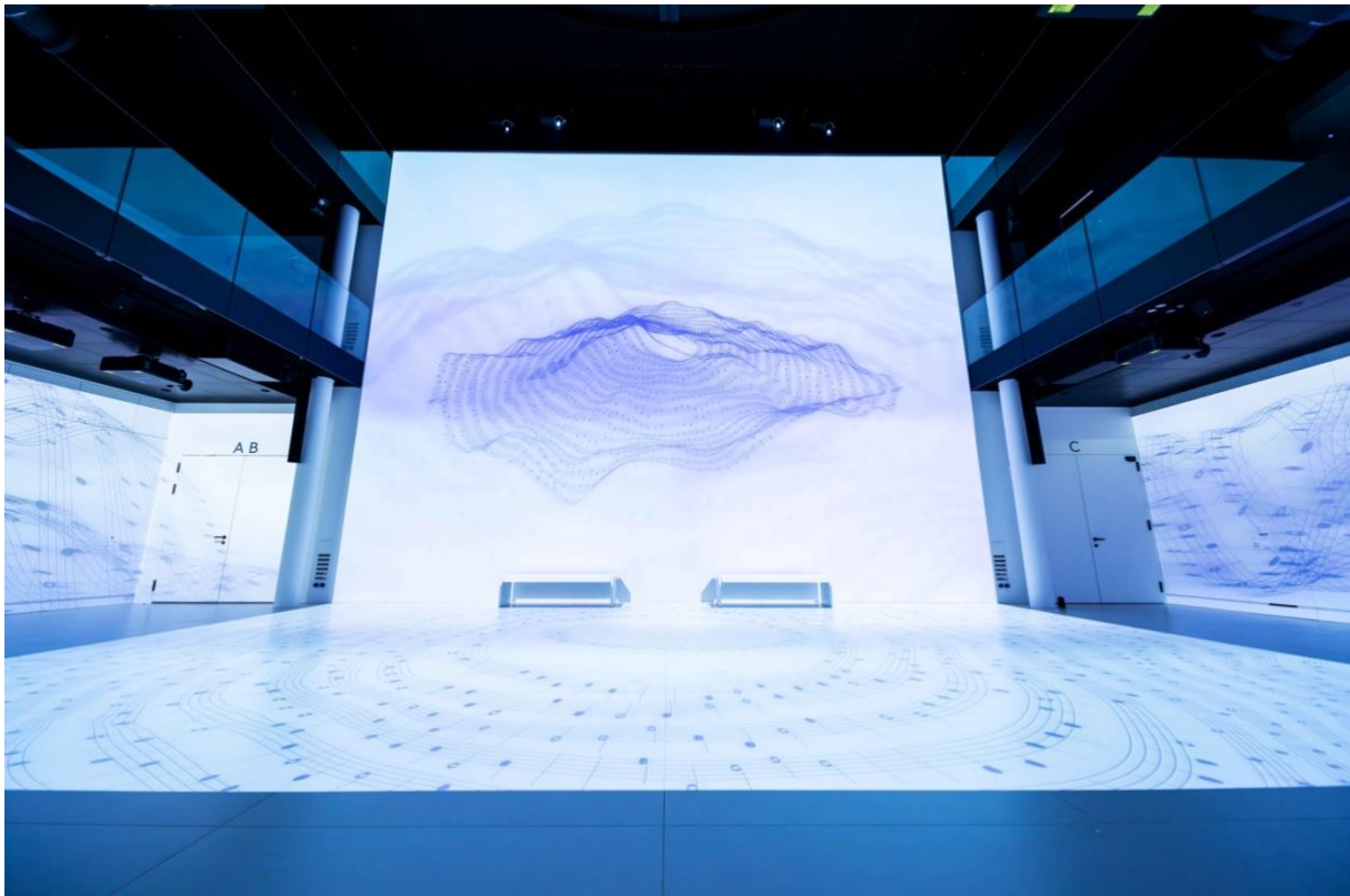
Bild 1: Die Veranstaltung «Meet your Taste» findet in den Eventsälen des Neuro Campus Hotel DAS MORGEN in Vitznau statt.

Vitznau im April 2024. Eine noch nie dagewesene kulinarische Expedition findet am 20. April im Herzen von Vitznau statt: Das Neuro Campus Hotel DAS MORGEN präsentiert in Zusammenarbeit mit der Klinik cereneo und dem Lake Lucerne Institut AG (LLUI) « Meet your Taste » ein kulinarisches Spektakel, das die Kunst der personalisierten Ernährung neu definiert. Das Event ist ein Fest der Sinne und ein Lehrstück der Geschmacksbildung, bei dem jeder Bissen von Innovation und Forschung inspiriert ist.