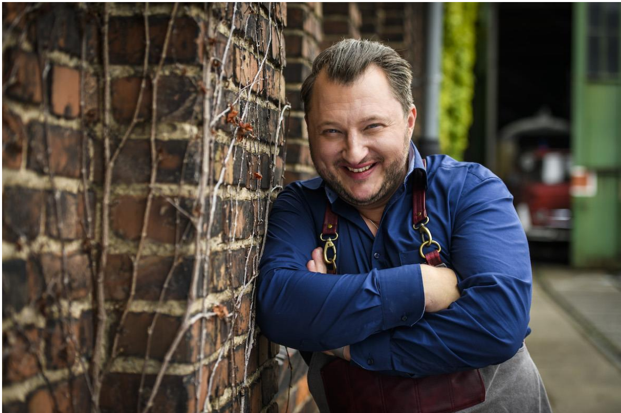
Bild 2: Sebastian Lege, Food Experte und Moderator von «Meet your Taste» spannende Inputs, um die Geschmacksnerven zu stimulieren.

Die Gäste durchlaufen einen multisensorischen Sinnesparcours, der den Gaumen herausfordert und den Geist anregt. Bei einem Walking Dinner, welches das traditionelle Konzept der Kitchenparty revolutioniert, haben die Teilnehmenden die Möglichkeit, ihre Speisen individuell zusammenzustellen und in Echtzeit von Spitzenköchen zubereiten zu lassen. «Meet your Taste» ist weniger ein klassisches Tasting als vielmehr ein Abenteuer. Die Botschaft dahinter: Lebensmittel sind nicht nur Zutaten, sondern eine Wissenschaft für sich.